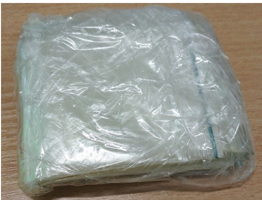
Zdjęcie nr 7