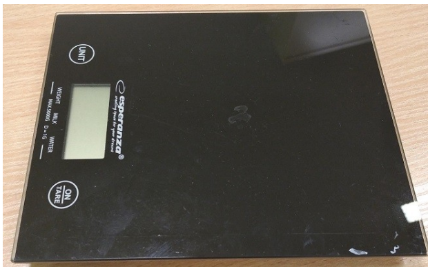
Zdjęcie nr 8