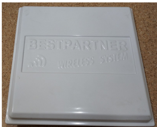
Zdjęcie nr 7