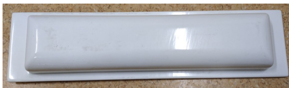
Zdjęcie nr 8